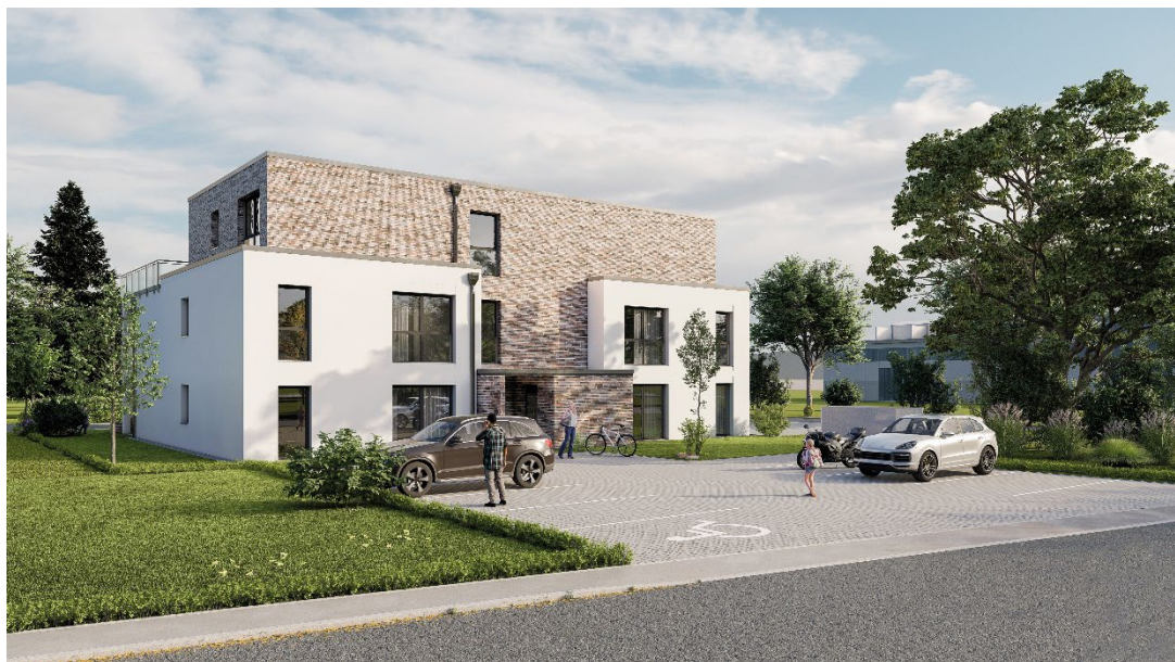
Bild dient nur zur Veranschaulichung